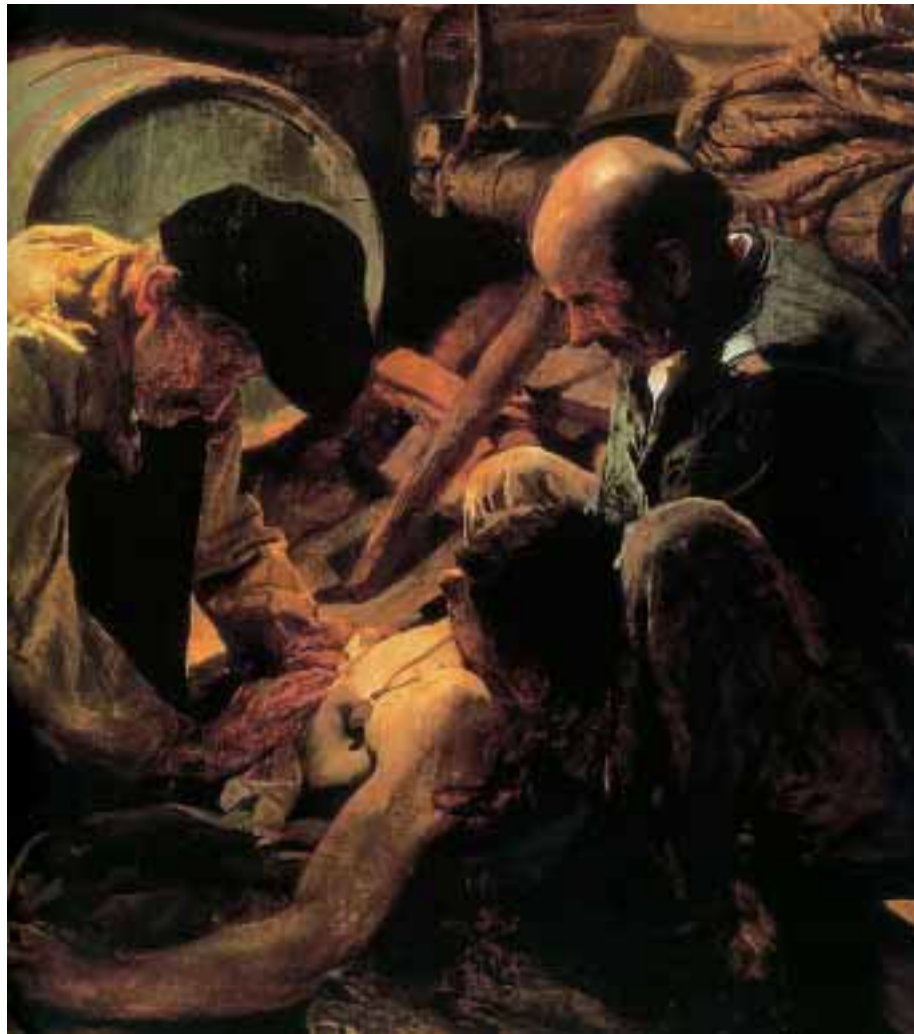
Sorolla expresa todo el dramatismo en su pintura de un hombre herido.

del propio cuerpo ligeramente aturdido, y de saborear la sensación extraña de sentirse con más intensidad o, simplemente, de sentirse, pues, hasta que no hay choque, sólo existe para el niño el mundo exterior; él no es más que unos ojos que ven, un observador que no se sabe a sí mismo como alguien. La experiencia de lo que los adultos llamarían dolor (en su grado más leve, por supuesto) puede ser para el niño no condicionado una primera toma de conciencia, y grata, de su ser-cuerpo, del sitio que ocupa en el mundo.