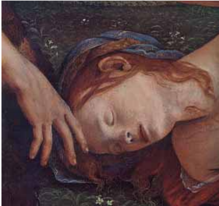
Piero di Cosimo capta en su «Escena Mitológica» el rostro de la agonía de una muchacha.

¿Y los otros, los acompañantes? Si nuestra propia memoria borra las huellas de los dolores más terribles (¡bendito olvido!), ¿cómo podremos pretender que otro, a través de lo que llamamos «empatía», pueda hacer otra cosa que asistir «dolorosamente» a un espectáculo en el que se siente implicado? Su sufrimiento es de otro tipo: pena de ver sufrir a un ser amado, temor o angustia ante la idea de perderle, miedo, incluso, ese miedo soterrado pero no menos acuciante que resulta de reconocer, a través del otro, la propia fragilidad y la aplazada pero inevitable caducidad... Los otros, el otro, no pueden compartir la experiencia del dolor; de ahí la soledad de quien padece, incluso si está rodeado de personas que le aman, pues a nadie, aunque quisiera,