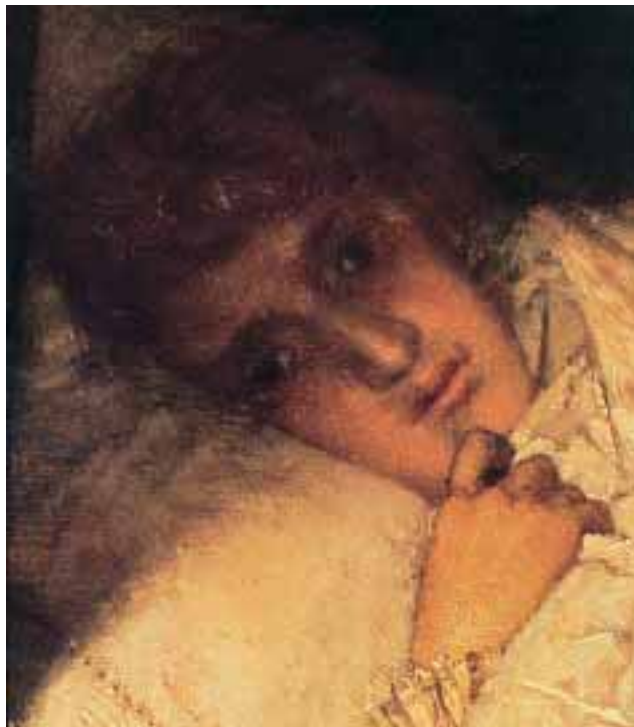
En la obra de Alma-Tadema se recoge en toda su intensidad la expresión de una mujer enferma.

Jünger habló de este cuerpo-objeto como de un proyectil, algo que pudiese ser lanzado al combate. Contraponía el mundo heroico, en el que, efectivamente, cabe una distancia (teórica, ideal) del sujeto para con el