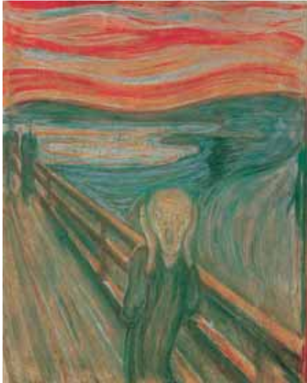
Parte de la obra de Edvard Munch -y de ello es buen ejemplo el cuadro El Grito - está inspirada en la enfermedad y la trágica muerte de sus familiares y amigos.