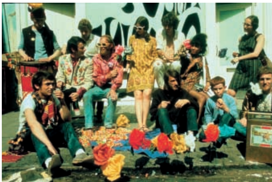
El incremento de los tratamientos no convencionales se produjo en el entorno de lo que se denominó movimientos contraculturales, como el movimiento «hippy».

Hay que buscar el origen de los TNC en el inicio de la década de los años 70 del siglo pasado, y específicamente en el entorno de lo que se denominó movimientos contraculturales, coincidentes con la escalada del conflicto del Vietnam y los movimientos «hippy» y radicales. Por una parte, ciertos sectores de crítica radical iniciaron en los EEUU una crítica frontal, articulada, al « stablishment » sanitario, específicamente a la American Medical Association y a la industria farmacéutica 6 , llegándose a acuñar el término de « medical-industrial complex » 7 , con cierta simetría