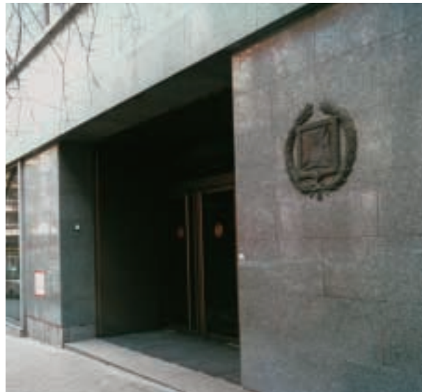
En España, la preocupación por las medicinas no convencionales es escasa. Incluso los propios colegios profesionales no se han pronunciado en general más allá de la defensa de los derechos corporativos, sobre todo para evitar confusiones e intrusismo.

En España, cuando se utiliza algún sistema de clasificación de los TNC se suelen emplear los de origen americano. Cabría analizar estas medicinas por su distancia de la «ortodoxia», pero también por la naturaleza de su arraigo y por su fundamentación. M. Foz, en otro artículo de este mismo número de la revista, lo hace para la homeopatía, que cuenta con una cierta tradición en la Europa continental y también en España. Otras, como la medicina ayurvédica, tienen raíces en las religiones -o soteriologías- hindúes, y su adopción en buena parte no está desvinculada de los movimientos migratorios relacionados con el subcontinente hindú. Hay otras prácticas cuya naturaleza está más o menos enraizada en tradiciones populares y cuyos beneficios (y riesgos) no han sido