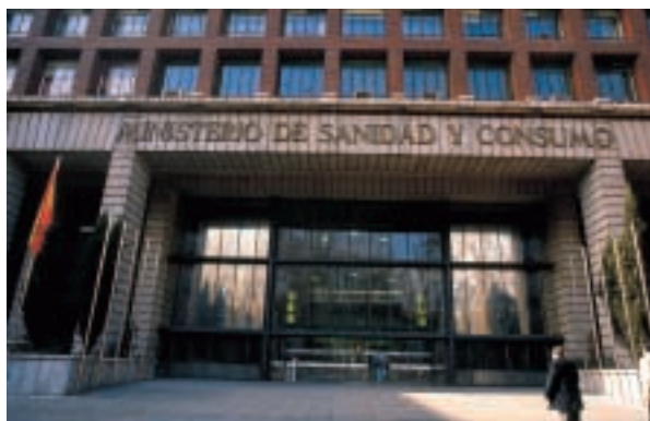
Hay diversas estimaciones respecto al alcance del uso de las medicinas no convencionales en países de nuestro entorno. Por lo que se refiere a España no hay datos al respecto.

Un indicador de la situación es la propia taxonomía. De largo, el término más utilizado es el de «medicinas alternativas», en singular o plural, tanto por